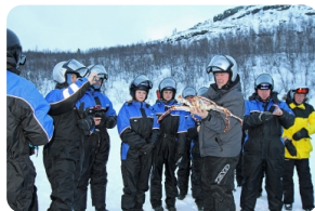
帝王蟹之旅含午餐