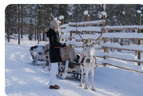
馴鹿雪橇叢林漫遊 (1KM)