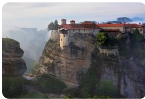
梅黛奧拉天空之城