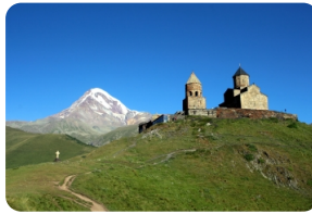
卡茲別克聖三一教堂