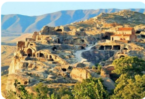
烏普利斯齊赫巖城