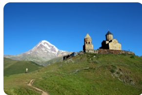
卡茲別克聖三一教堂