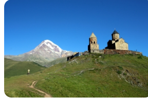
卡茲別克聖三一教堂