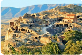
烏普里斯齊赫巖城