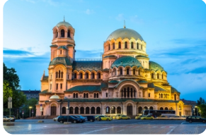
亞歷山大·涅夫斯基大教堂