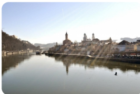
多瑙河 (三河交匯) 遊船