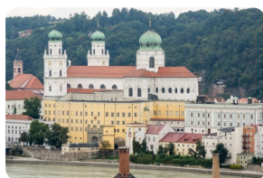
聖史蒂芬主座教堂