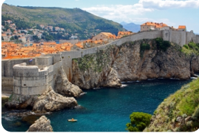
杜佈羅夫尼克城牆