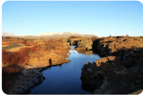
冰島古議會舊址(露天議會)