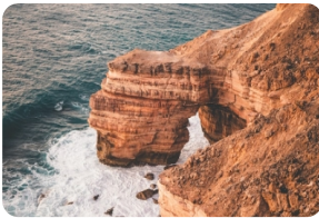
卡爾巴裡國家公園