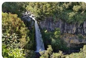
艾格蒙特國家公園