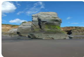
The three sister