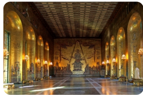
斯德哥爾摩市政所---諾貝爾晚宴會場