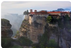
梅黛奧拉天空之城

(注：6座脩道院的開放時間各不相同，祇儘天情況選擇可以漫觀的脩道院，一般漫觀2座脩道院。脩道院有嚴格的著裝規定，不得裸露肩膀或膝蓋，女性必須穿裙子。如果沒有裙子，脩道院門口提供圍裙可以借用，請在入場前借一條。)