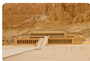
哈特謝普蘇特女王神廟