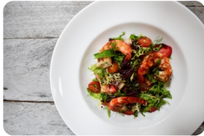
Garden Mesclun And Prawns