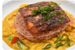
Grilled Sri-Lankan Reef Fish Fillet