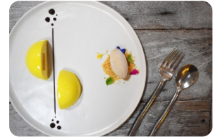
Mango Passion Fruit Sphere