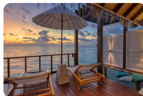
Wind Villa 海景