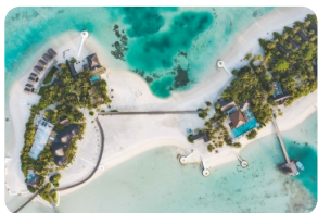
OZEN LIFE MAADHOO 全景 [OZEN LIFE MAADHOO 全景] [Floating Breakfast 定制餐食] [Wedding 婚禮]