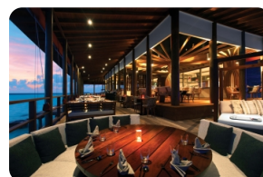
Tradition Peking 餐所