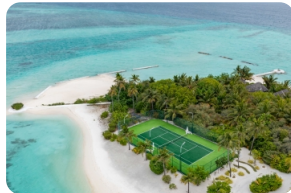
Tennis Court 網球場