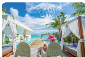
Salt Pool Lifestyle