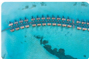
Wind Villas 全景