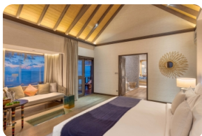
Wind Villa 臥室