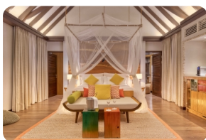
Earth Villa 臥室