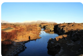
冰島古議會舊址(露天議會)

冰島所處地理位置特殊，風景壯觀奇特，天氣也容易多變。為了安全起見，經驗豐富的資深導遊會隨時根據實際天氣情況進行行程上的調整（極端天氣時，在保障客人安全的前提下可能會取消相應景點），以保證行程順利進行，敬請諒解。