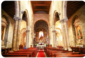
奧利維拉聖母教堂