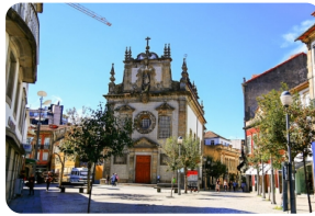
布拉加共和國廣場