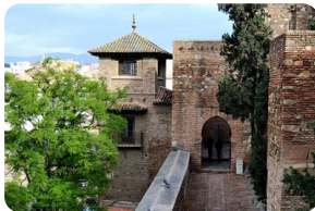
馬拉加阿爾卡薩瓦城堡

https://www.alcazarsevilla.org/en/schedules-rates/