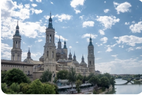
比拉爾聖母大教堂