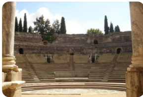
梅裡達羅馬圓形劇場

注：本網頁內所標注時間均為參考時間，實際抵達時間會因各種不可抗力原因如天氣，堵車，交通意外，節日賽事，騷亂罷工等有晚點可能，請您見諒。您如有後續行程安排需搭乘其他交通工具前往其他城市，我們強烈建議您至少預留3小時以上的空餘時間，以免行程延遲受阻為您帶來不便。由於您沒有預留足夠的空餘時間而導致的自行安排行程有所損失，我公司概不負責，敬請諒解。