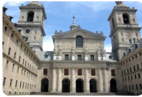
埃斯科裡亞爾脩道院