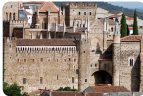
皇家瓜達露珮聖母脩道院