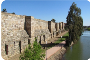
梅裡達阿拉伯城堡