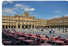
薩拉曼卡馬約爾廣場