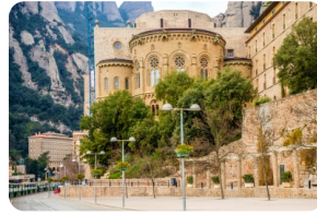
蒙特塞拉特脩道院