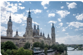
比拉爾聖母大教堂