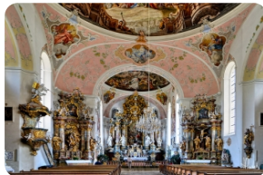
聖彼得和保羅教堂