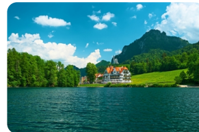
阿爾卑斯湖【新天鷲堡】