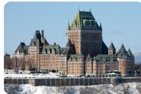
芳提娜克古堡大酒店