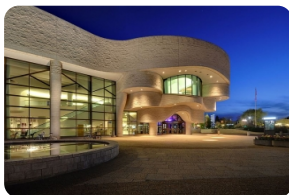
加拿大歷史博物館