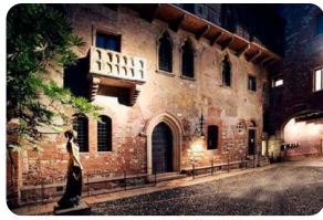
茱麗葉陽台與茱麗葉故居