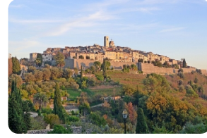
聖保羅·德旺斯--與藝術的一場美麗邂逅