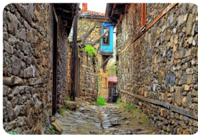
硃馬勒克茲克小鎮