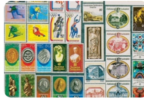
列支敦士登郵票博物館