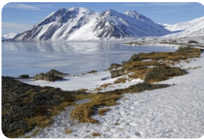
The East Fjords