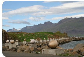
鳥蛋Eggin i Gledivik