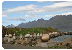
鳥蛋Eggin i Gledivik