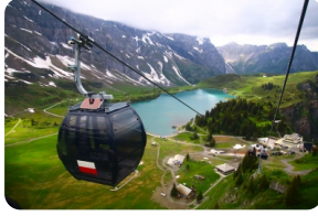
鐵力士山雪地體驗樂園