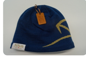
鐵力士官方Logo保暖滑雪帽