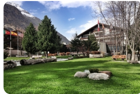
文根小鎮--阿爾卑斯山風情的童話小鎮