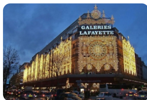
老佛爺百貨公司（奧斯曼旗艦店）