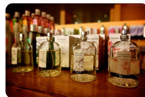
巴黎花宮娜香水博物館