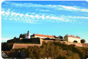
彼德羅瓦拉丁堡壘