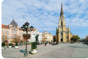
諾維薩德自由廣場