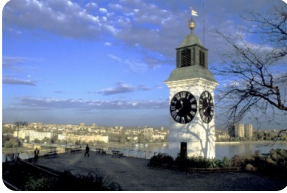
彼得羅瓦拉丁要塞

注：本網頁內所標注時間均為漫考時間，實際抵達時間會因各種不可抗力原因如天氣，堵車，交通意外，節日賽事，騷亂罷工等有晚點可能，請您見諒。您如有後續行程安排需搭乘其他交通工具前往其他城市，我們強烈建議您至少預雷3小時以上的空餘時間，以免行程延遲受阻為您帶來不便。由於您沒有預雷足夠的空餘時間而導致的自行安排行程有所損失，我公司概不負責，敬請諒解。