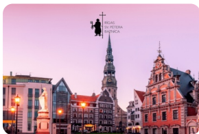
裡加聖彼得大教堂