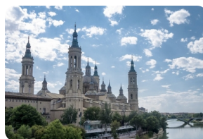
比拉爾聖母大教堂