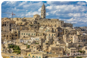
薩西民居和洞穴屋