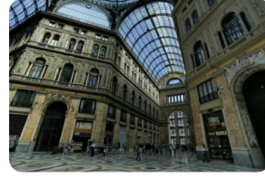
翁貝托一世拱廊街