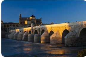
科爾多瓦古羅馬橋