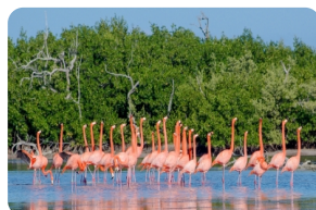
拉加托斯景區 (Ria Lagarto)