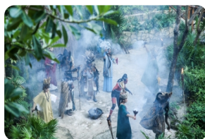
西卡萊特主題公園

以上行程時間安排可能會因天氣、路況等原因做相應調整，敬請諒解；如出行當天您有返程計劃（乘飛機或火車等）請提前與我社說明，以免耽誤您的行程。