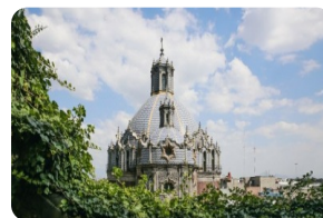
瓜達盧珮聖母大教堂