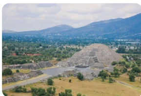
特奧蒂瓦坎金字塔

**以上行程時間安排可能會因天氣、路況等原因做相應調整，敬請諒解；如出行當日您有返程計劃（乘飛機或火車等）請提前與我社說明，以免耽誤您的行程。