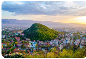
普羅夫迪夫老城區