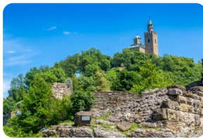
大特爾諾沃古城堡