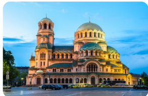
亞歷山大·涅夫斯基大教堂