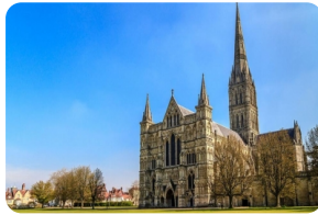
聖彼得和聖保羅大教堂