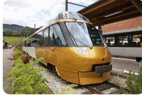
金色山口快車 Golden Pass Line