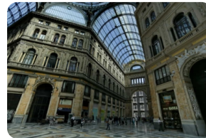
翁貝托一世拱廊街