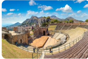
希臘露天圓形劇場