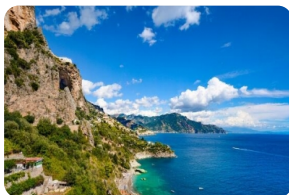
阿馬爾菲北部海岸線

本網頁內所標注時間均為參考時間，實際抵達時間會因各種不可抗力原因如天氣，堵車，交通意外，節日賽事，騷亂罷工等有晚點可能，還請您見諒。您如有後續行程安排需搭乘其他交通工具前往其他城市，我們強烈建議您至少預留3小時以上的空餘時間，以免行程延遲受阻為您帶來不便。由於您沒有預留足夠的空餘時間而導致的自行安排行程有所損失，我公司概不負責，敬請諒解。