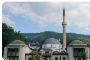
薩拉熱窩大清真寺