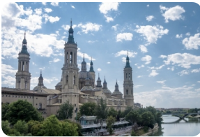
比拉爾聖母大教堂