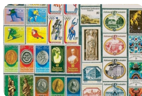
列支敦士登郵票博物館